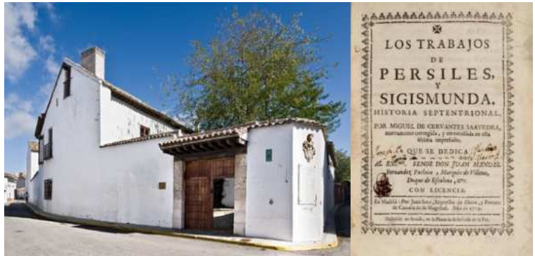
Casa Museo de Cervantes en Esquivias

Como puede apreciarse, la falta de un mínimo de sentido de la lógica hace que el lector “avisado” busque el verdadero sentido en ese otro lenguaje que corre paralelo al literal. Pues, desde una perspectiva alegórico-simbólica, ese arco y su flecha remiten, por su expresada grandeza y antigüedad, respectivamente, a esa imagen que se proyecta en los cielos de la constelación de Sagitario; que, según la tradición de las eras astrológicas inserta en ese “reloj universal” que es la precesión de los